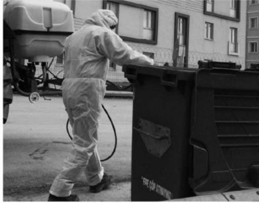
İzmit Belediyesi karantina yurtları önünde bulunan çöp konteynerlerini, koronavirüsle mücadele kapsamında ilaçlayarak, dezenfekte etti.

konteynerlerini, koronavirüsle mücadele kapsamında ilaçlayarak, dezenfekte etti. Belediye yetkilileri, ilaçlama çalışmalarının periyodik olarak süreceğini belirtti.