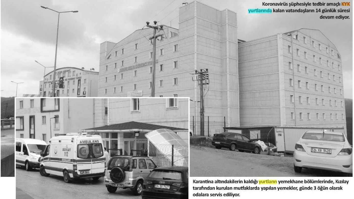
Koronavirüs şüphesiyle tedbir amaçlı KYK yurtlarında kalan vatandaşların 14 günlük süresi devam ediyor.

Karantina altındakilerin kaldığı yurtların yemekhane bölümlerinde, Kızılay tarafından kurulan mutfaqlarda yapılan yemekler, günde 3 öğün olarak odalara servis ediliyor.